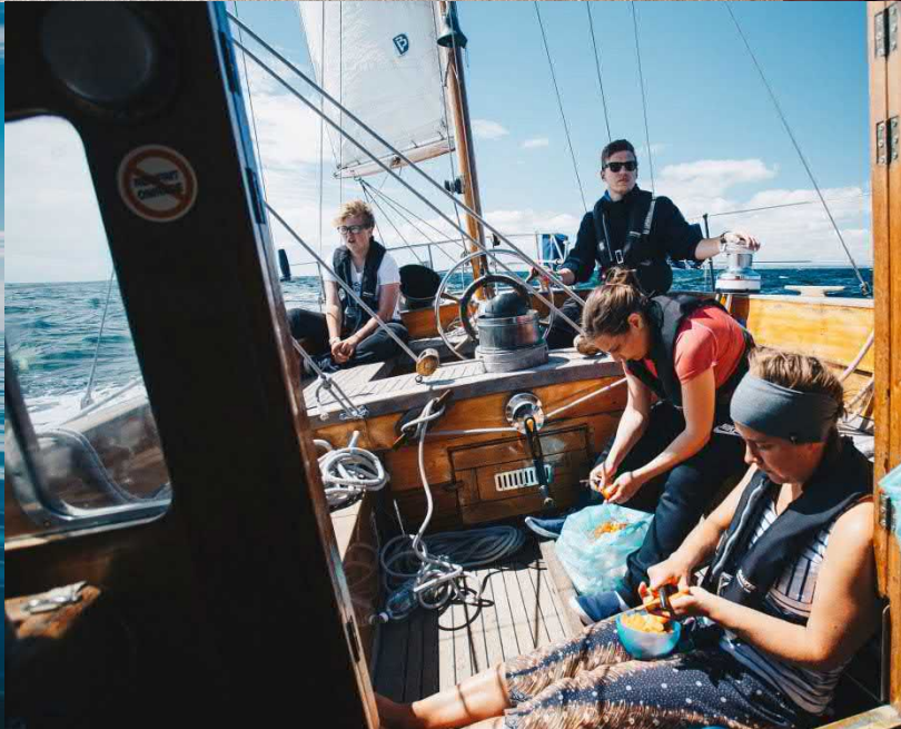
TSR2017 Halmstad - Kotka